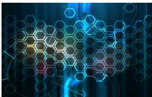
Figura 1: Inserte el título para colocar el título debajo de la figura (Arial 10)